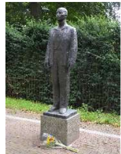
Dreef. Man voor het vuurpeloton