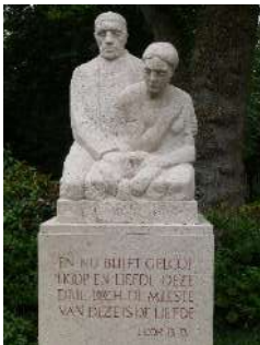
Jan Gijzenkade. '...de meeste is de Liefde'