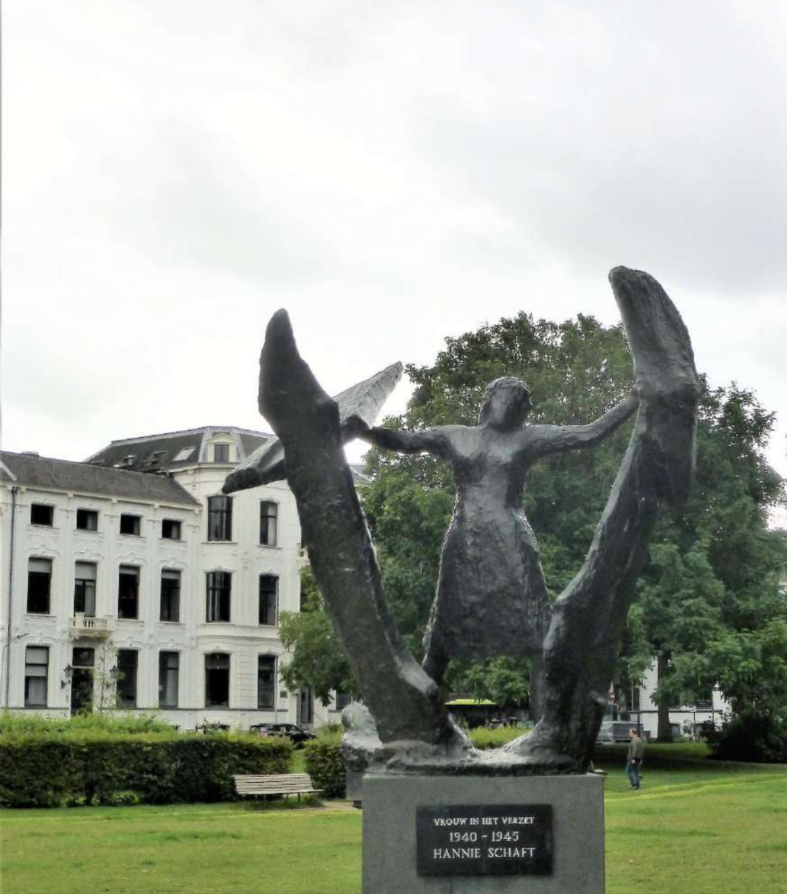
VROUW IN HET VERZET 1940 - 1945 HANNIE SCHAFT