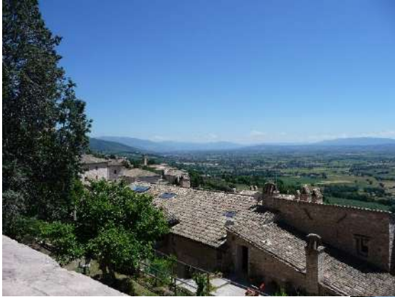
Assisi en ommelanden