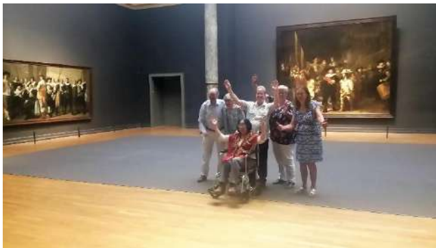
KBO Haarlem in 2018 met de MuseumPlusBus in het Rijksmuseum.