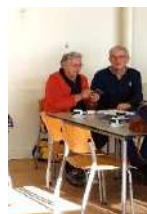
Impressie van de ALV en overdracht van het voorzitterschap