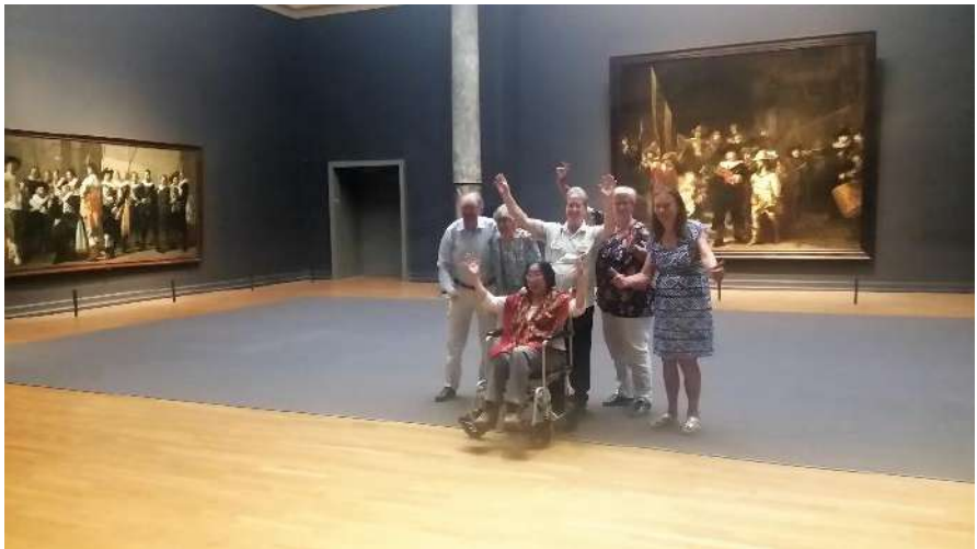
KBO Haarlem in 2018 met de MuseumPlusBus in het Rijksmuseum.

NL15 INGB 0007 2874 57 t.n.v. KBO Haarlem afd. Reizen