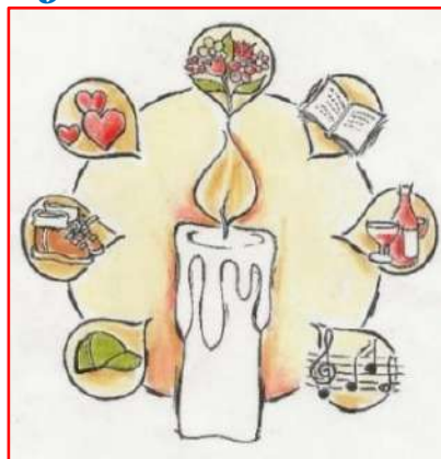
illustratie van Annelie Versteeg

De afgelopen perioden overleden acht KBO Haarlem leden. We herdenken ook de overledenen die niet vermeld staan.