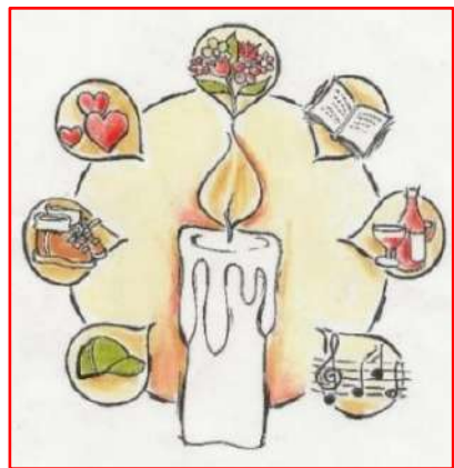
illustratie van Annelie Versteeg

We herdenken de twaalf KBO Haarlem leden, die onlangs overleden, maar ook de overledenen die niet vermeld staan.