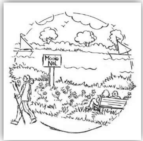
illustratie van Annelie Versteeg

En ten noorden zijn de weggegraven landerijen langs de Slaperdijk bewaard gebleven en zie je de zichtlijn vanaf Santpoort naar Spaarndam met de historische Slaperdijk, het tolhuis, de kazematten en het uitzicht vanaf de Spaarndammerdijk.