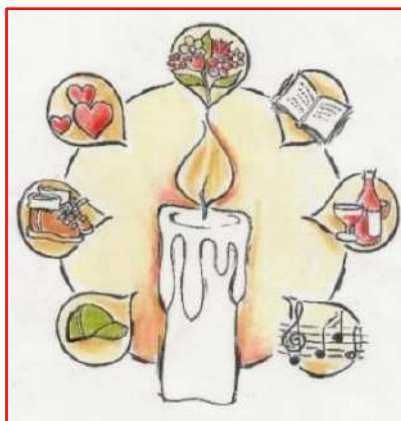
illustratie van Annelie Versteeg

De afgelopen periode overleden 18 KBO Haarlem leden. We herdenken ook de overledenen die niet vermeld staan.